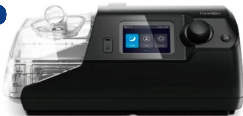
BA725W - ST730